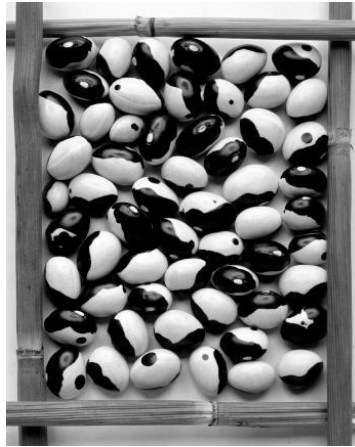
Foto: Ying-yang bonen voor in de moestuin

Een boerderij is voor kinderen een plek waar veel te beleven is en waar kinderen de ruimte hebben om te spelen. Een veilige en prettige sfeer binnen kinderopvang Tierelier heeft een hoge prioriteit. Wanneer een kind zich veilig voelt en vertrouwen heeft, durft het te ontdekken en er op uit te gaan. Kinderopvang is een aanvulling op de thuissituatie. Het is belangrijk dat de wereld thuis en het leven op de kinderopvang op elkaar aansluiten. Door goed contact met de ouders worden deze twee leefwerelden met elkaar verbonden. Wij houden zoveel mogelijk rekening met de regels, gewoonten, waarden en normen die de ouders het kind mee willen geven.