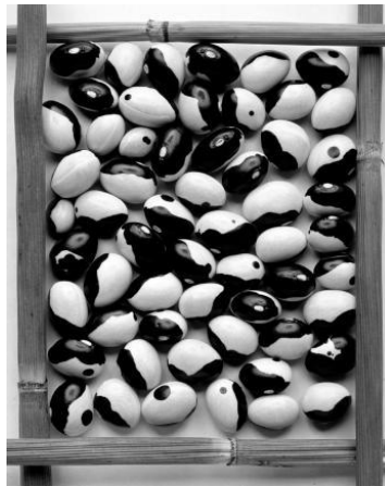
Foto: Ying-yang bonen voor in de moestuin

Een boerderij is voor kinderen een plek waar veel te beleven is en waar kinderen de ruimte hebben om te spelen. Een veilige en prettige sfeer binnen kinderopvang Tierelier heeft een hoge prioriteit. Wanneer een kind zich veilig voelt en vertrouwen heeft, durft het te ontdekken en er op uit te gaan. Kinderopvang is een aanvulling op de thuissituatie. Het is belangrijk dat de wereld thuis en het leven op de kinderopvang op elkaar aansluiten. Door goed contact met de ouders worden deze twee leefwerelden met elkaar verbonden. Wij houden zoveel mogelijk rekening met de regels, gewoonten, waarden en normen die de ouders het kind mee willen geven.